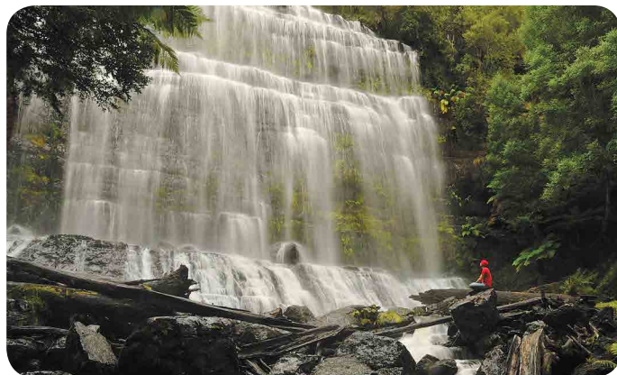
Russell Falls