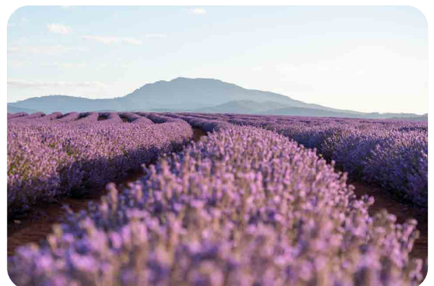
Bridestowe Lavender Estate