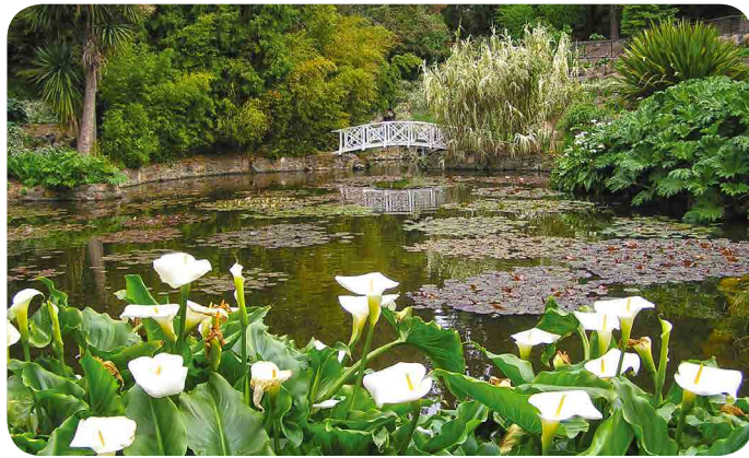
The Lily Pond - Royal Tasmanian Botanical Gardens