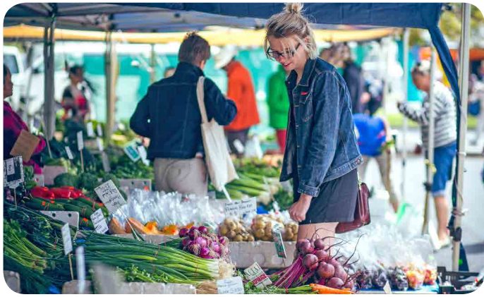
Salamanca Market