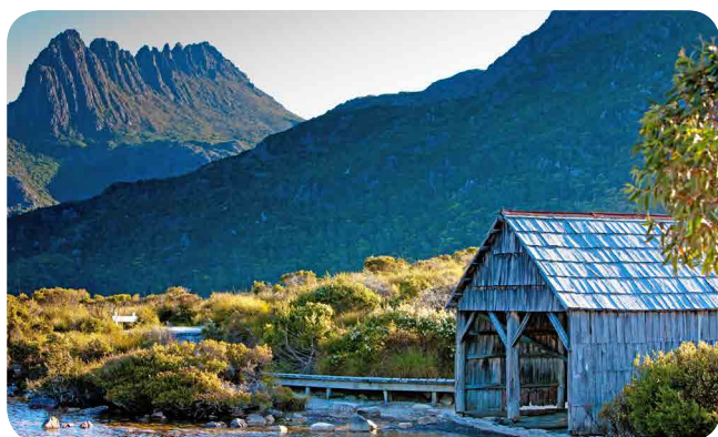
Boat Shed, Lake Dove and Cradle Mountain