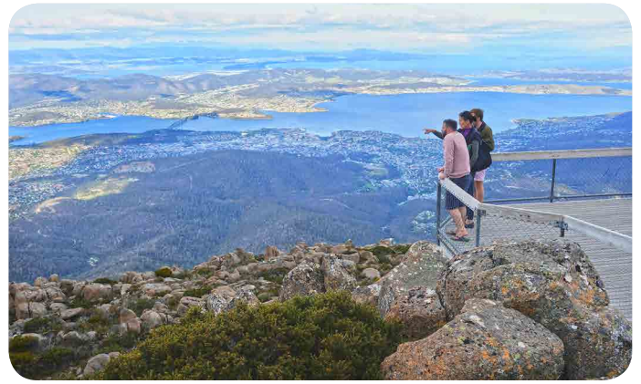
View of Hobart from Mt Wellington/kunanyi Lookout