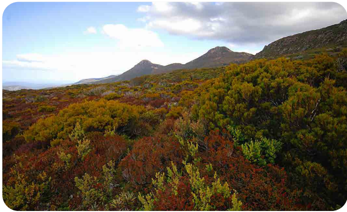
Hartz Mountains National Park