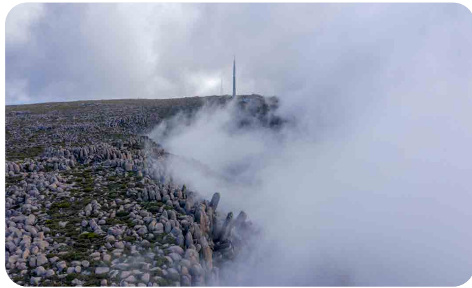
Summit of Kunanyi/Mt Wellington