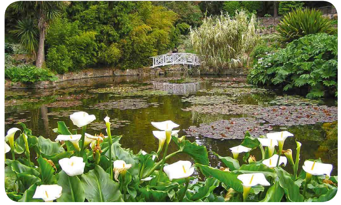
The Lilly Pond – Royal Tasmanian Botanical Gardens