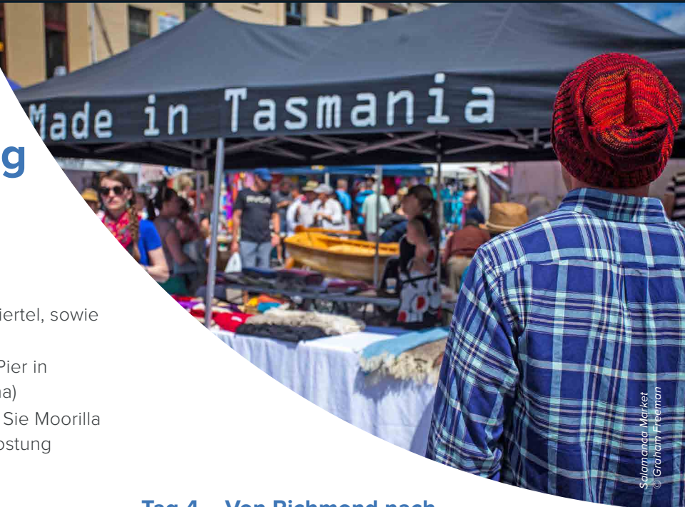
Salamanca Market