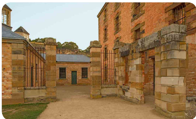
Penitentiary – Port Arthur Historic Site