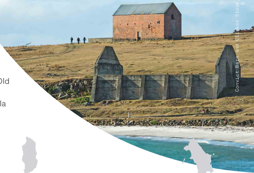
Convict Barn and Clinker Store, Maria Island