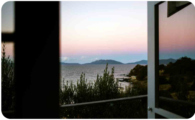
View of Swansea