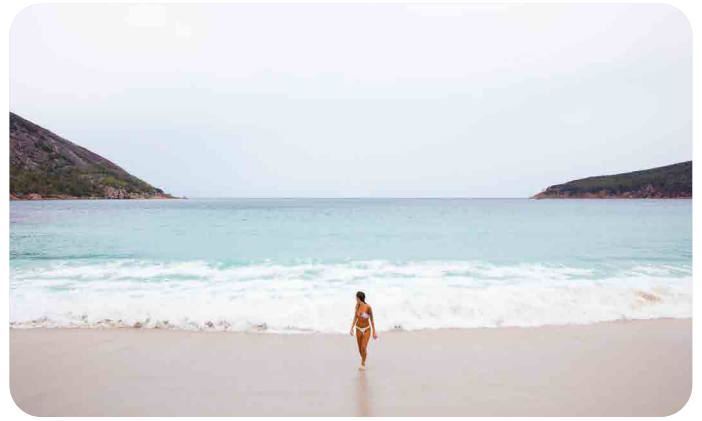
Wineglass Bay Beach