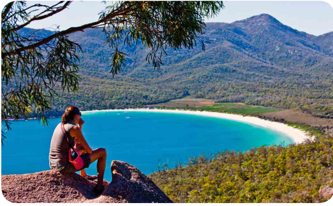
Wineglass Bay from Wineglass Bay Walking Track