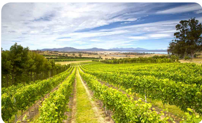
Devil's Corner Cellar Door