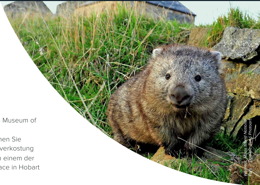
Wallaby, Maria Island National Park